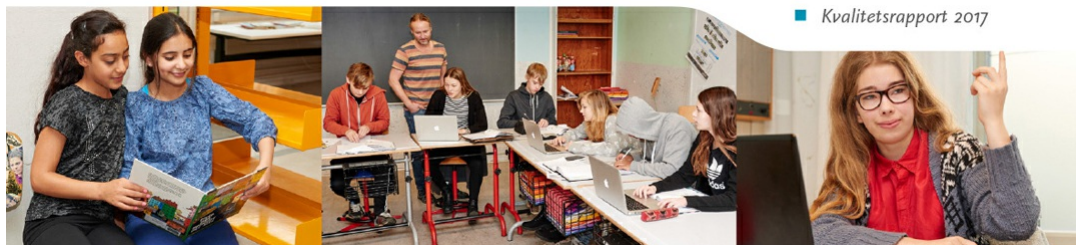
■ Kvalitetsrapport 2017

Datakilde: Børn og Unges administrative systemer